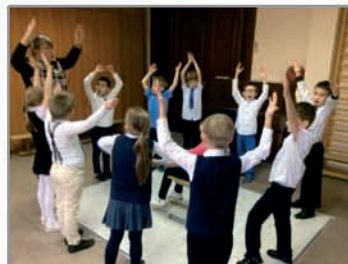
Музыкально-ритмические занятия способствуют формированию эмоциональной речи