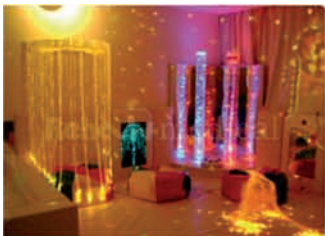
Сенсорная комната психолога помогает снять эмоциональное и физическое напряжение

Для обеспечения максимального уровня развития детей используются современные методики специальной педагогики и психологии : фонетическая ритмика, пальчиковая и артикуляционная гимнастика, логопедический массаж, занятия в сенсорной комнате, развивающие занятия с дидактическими пособиями, занятия в компьютерном классе, ЛФК.