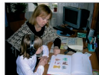
Сурдопедагог проводит индивидуальные занятия по развитию слуха и обучению произношению